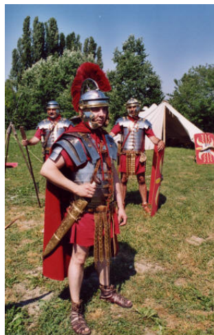
Comune di Quarto d'Altino RIEVOCAZIONI ROMANE Accampamento dei legionari, animazione con personaggi in costume e spettacolo di danze ispirate all'antichità romana (24 maggio 2003)

In definitiva, tali periodi di servizio, svolti in zone di intervento per conto dell'ONU, sono supervalutabili quali campagne di guerra ai fini dell'indennità di buonuscita tramite riscatto oneroso senza limitazione quinquennale. Così se un militare (di qualsiasi grado, ovviamente) in un anno solare ha prestato servizio in zona di intervento per conto dell'ONU per almeno tre mesi, anche non continuativi, ha diritto al riscatto di una campagna di